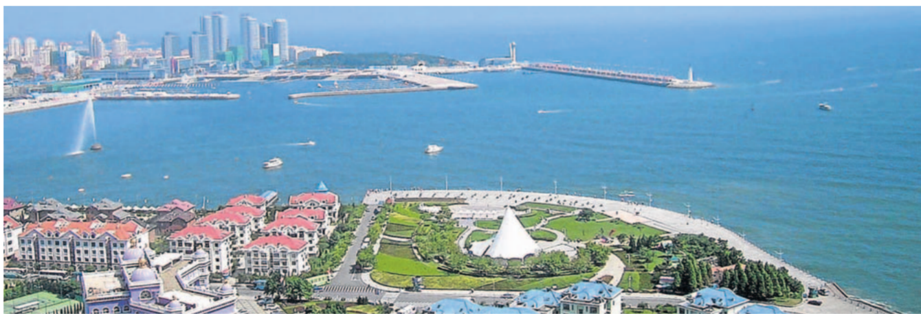
Gute Aussicht: der Blick von der bayerischen Repräsentanz in Shandong auf die Bucht von Qingdao.