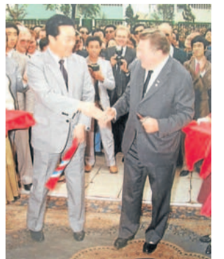
Partner: Franz Josef Strauß 1985 mit dem Provinz-Chef von Shandong (in Qingdao).

neutgrößten der Welt. Ab 1904 brauten deutsche und britische Ingenieure hier Bier, den Vorläufer des „Tsingtau Beer“, das weltweit vertrieben wird. Nicht zuletzt das Bier schlug eine Brücke zu Bayern. Der Freistaat Bayern hat mehrere Partnerprovinzen. Dazu zählen Oberösterreich, Sao Paulo in Brasilien, Quebec in Kanada, Georgia, Westkap in Südafrika – und die ostchinesische Küstenprovinz Shandong. Die Zusammenarbeit begann bereits in den frühen achtziger Jahren. Am 9. Juli 1987 begründeten Bayern und Shandong