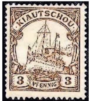
Eine Briefmarke der Kolonie Kiautschou.

Qingdao ist einer der wenigen bedeutenden Badeorte in China. Die Deutschen gaben der Stadt einst den Beinamen „Neapel am Gelben Meer“. Die Stadt besitzt den drittgrößten Hafen Chinas und den