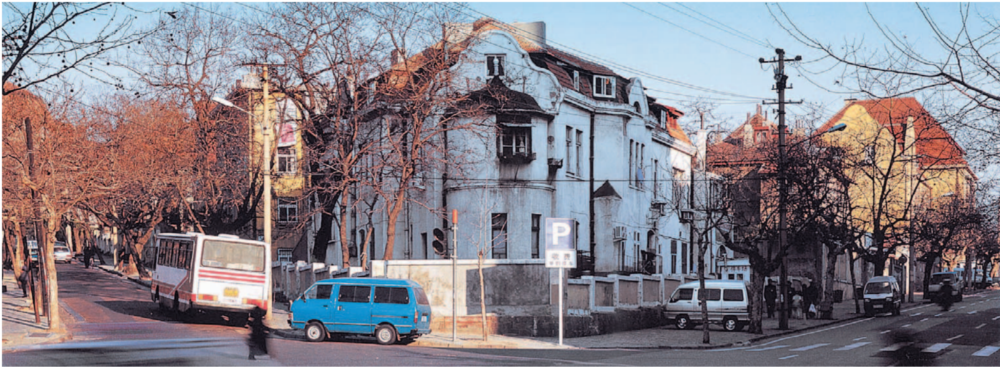
Könnte in München sein – ist aber in Qingdao: Das Bild zeigt die Zhongshan Straße im alten deutschen Wohnviertel der ostchinesischen Küstenstadt.