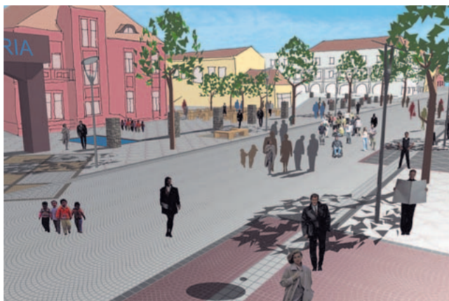
Deutsches Flair: So soll die Zheijang Straße nach Plänen von Fritz Hubert einmal aussehen.