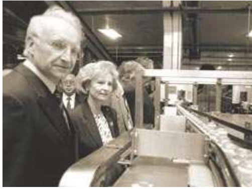
Besichtigung der Qingdao-Brauerei

Im April 1995 besuchte Ministerpräsident Edmund Stoiber knapp zwei Jahre nach seinem Amtsantritt auf seiner ersten großen Auslandsreise erstmals Shandong, sein zweiter Besuch fand acht Jahre später, im März 2003, statt. Zwischen 1993 und 2000 besuchten bayerische Politiker mindestens 15 Mal