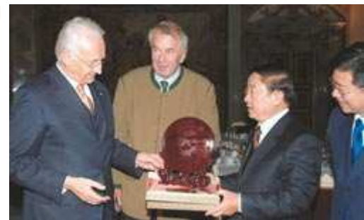
Der Bayerische Ministerpräsident Edmund Stoiber erhält vom Gouverneur von Shandong, Han Yuqun, ein traditionelles chinesisches Geschenk im Beisein des Staatssekretärs im Bayerischen Staatsministerium für Wirtschaft, Infrastruktur, Verkehr und Technologie, Hans Spitzner

Zudem kamen im gleichen Zeitraum mindestens weitere 75 Mal Minister, Vizegouverneure, Beamte, Wissenschaftler oder Wirtschaftsvertreter aus China und insbesondere aus Shandong nach Bayern, um mit den bayerischen Kabinettsmitgliedern bilaterale Fragen zu erörtern. 8) Im Zeitraum 2001 bis 2006 sind der Besuch des damaligen Vizepräsidenten und heutigen Staatspräsidenten Hu Jintao (2001) sowie von Gouverneur Han (2005) in Bayern und fast 40 Besuche von Ministern, Vizegouverneuren, Beamten usw. aus Shandong zu verzeichnen. Im April 2005 besuchte Staatsminister Otto Wiesheu Qingdao, Jinan, Peking und Shanghai. Sein Nachfolger Staatsminister Erwin Huber setzte die regelmäßige Pflege der Außenwirtschaftsbeziehungen mit einem Besuch in Shandong im Mai 2006 fort.