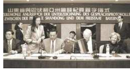
Ministerpräsident Stoiber und seine Frau auf Besuch in Shandong, April 1995