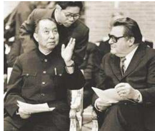
1979: Der damalige Ministerpräsident der Volksrepublik China, Hua Guofeng, mit Ministerpräsident Franz Josef Strauß in München