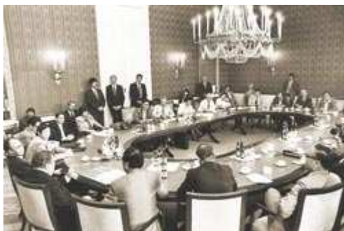
Die Unterzeichnung der Partnerschafts-urkunde im Prinz-Carl-Palais, München, am 9.7.1987

Die Absichtserklärungen von 1985 mündeten schließlich am 9. Juli 1987 in die „Gemeinsame Erklärung zur Herstellung freundschaftlicher Beziehungen zwischen der Provinz Shandong in der Volksrepublik China und dem